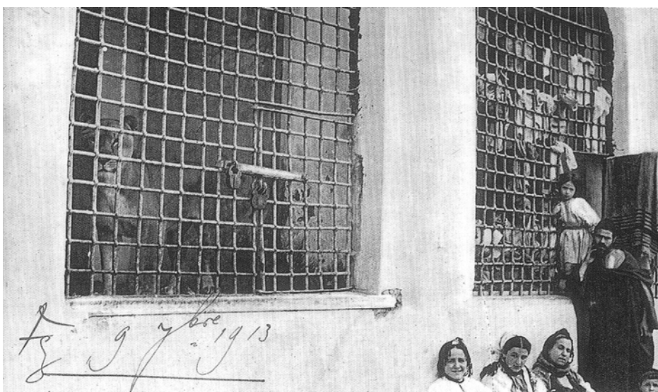
Überlebende des Pogroms von Fez im April 1912 finden im Zoo des Sultans Zuflucht. In einem Käfig hausen Löwen, in einem anderen Juden

In der Praxis der islamischen Gesellschaften gab es also verschiedenste Anwendungsformen obiger Rechtsgrund-