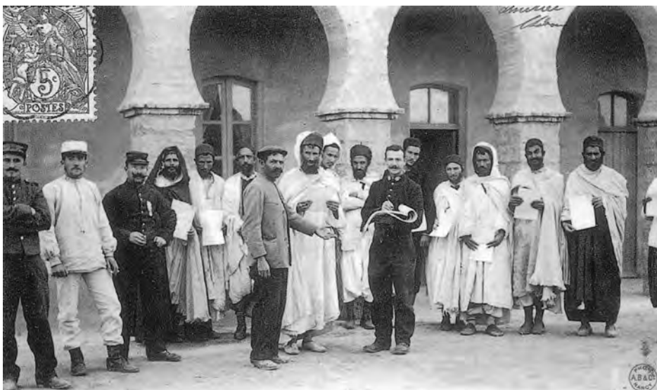
Um ihrem Status als entrechtete Minderheit zu entgehen, wenden sich die 500 Juden der marokkanischen Oase Figuig an die französischen Militärs, um die französische Staatsbürgerschaft zu erlangen

Logischerweise und ungeachtet obiger Reaktionen der Muslime weckten der zunehmende Einfluss der europäischen Mächte und schließlich die französische Kolonialherrschaft bei vielen Juden Nordafrikas die Hoffnung auf eine Befreiung aus ihrer Bedrückung. Das schlug sich auch darin nieder, dass sich allenthalben Juden aus ihrer gewohnten Unterwürfigkeit zu lösen und auf die