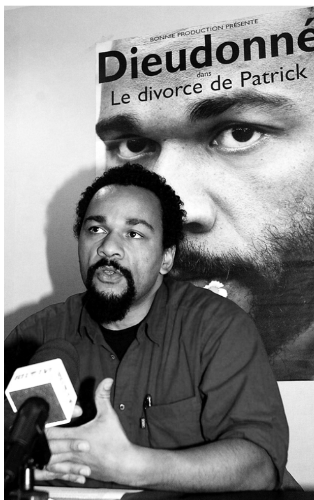
Der Komiker und Bühnenautor Dieudonné M'Bala M'Bala, Sprachrohr der antijüdischen Ressentiments unter Franko-Afrikanern und Franko-Arabern

In einem Gespräch, das der franko-arabische Radiosender in Paris, „Beur FM“, im März 2005 ausstrahlte, verriet M'Bala M'Bala, er habe die Seiten, die sich mit dem Holocaust beschäftigen, aus den Schulbüchern seiner Kinder „herausgerissen“. Daraufhin äußerten erstmals prominente schwarze Intellektuelle ihre Ablehnung. Die meisten französischen Medien traten Dieudonné M'Bala M'Bala vehement entgegen.