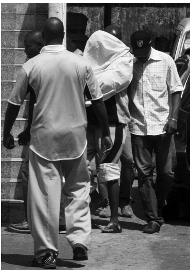
Festnahme des Entführers und mutmaßlichen Mörders Ilan Halimis: Youssouf Fofana

geforderte Summe nicht auftreiben. Als der geschiedene Vater doch noch das Geld zusammenbrachte, scheiterte die Übergabe an der chaotischen Vorgangsweise der Entführer.