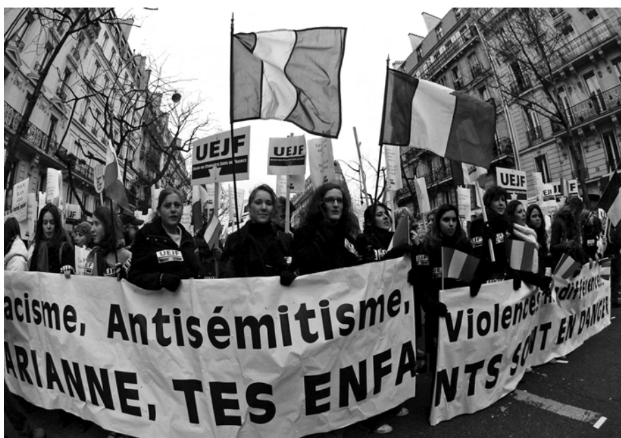
Demonstration gegen Rassismus und Antisemitismus, Paris, Februar 2006

Gegen diese Diskriminierungen haben sich Präsident Chirac und etliche weitere Entscheidungsträger zumindest verbal immer wieder engagiert. Es gibt Gesetze gegen Diskriminierung und Kampagnen gegen Ausgrenzung und Rassismus. Dieser öffentliche Diskurs greift aber in der gesellschaftlichen Realität nur ansatzweise und viel zu langsam. Die wirtschaftspolitischen Rahmenbedingungen sind denkbar ungünstig: Fast ein Viertel der (in keinem Ausbildungsverhältnis stehenden) Jugendlichen sind ohne Job. Damit verzeichnet Frankreich eine der höchsten Jugendarbeitslosenraten der EU. Bei Jugendlichen aus Migrantenfamilien ist diese Rate fast doppelt so hoch. Die